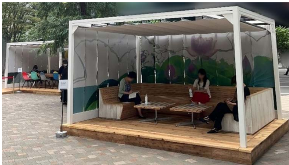
図 3. パーゴラ ※SPACECOOL ターポリン（防災、高強度）を使用

酷暑対策を目的とした大手町仲通り（東京都千代田区大手町1丁目9、実施：三菱地所株式会社）での実証実験に使用するパーゴラに採用。（図 3）