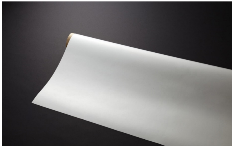
図 1 製品外観（色：白）

ターポリン生地 2 種類*1,2 は、公益財団法人日本防災協会認定の防災製品認定を取得しております。テントやシェード、カバーやパラソルなどの用途に使用できる素材です。