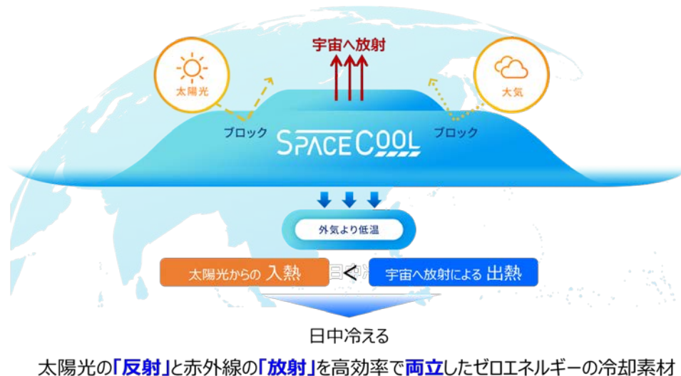
図 4. 本素材の概念図

*3：大阪ガス独自の放射冷却技術を用い、太陽光の入熱を抑え、熱放射による出熱（熱せられた物体の熱が電磁波・光として運ばれる現象）を大きくした材料設計により実現